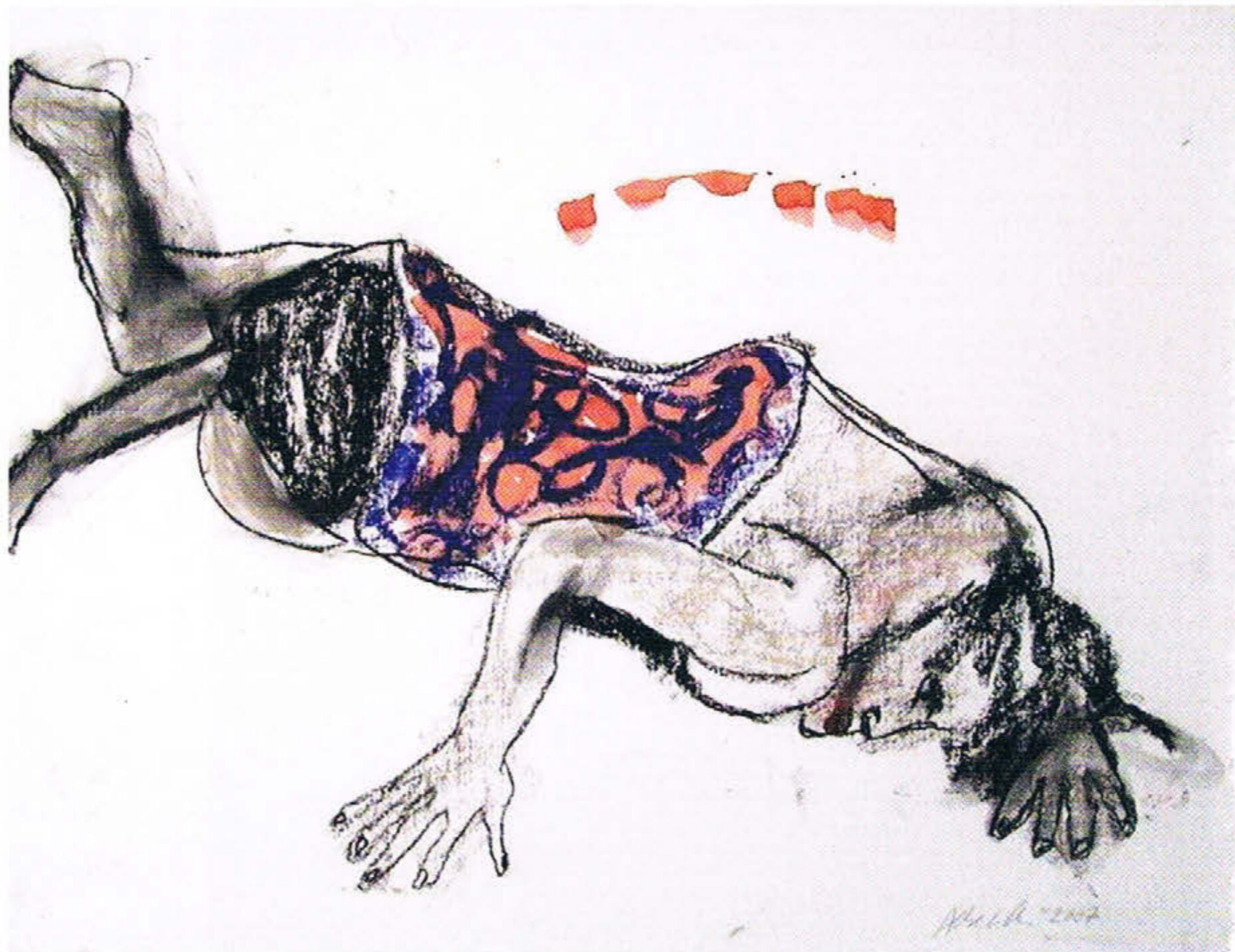
Sans titre. Encre et pastel sec sur papier, 50 cm x 65 cm.