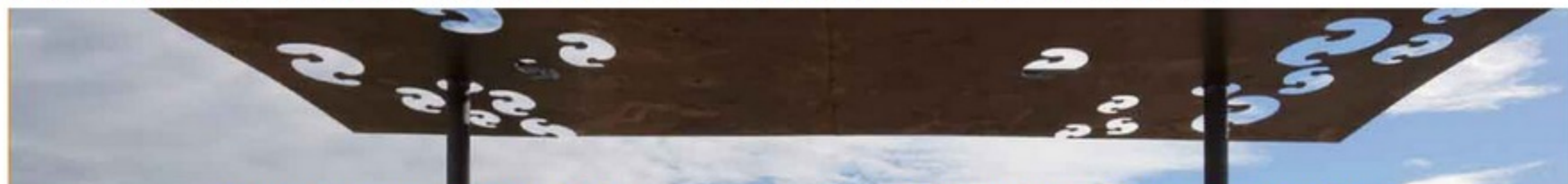
« Exposition « Bruissements » | Galerie Voies Off Arles